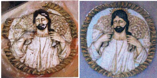
Het medaillon de Goede Herder vóór en na de restauratie.

Bij de werken aan de in 1786 opgerichte Calvarieberg werd het door houtworm en schimmels aangetaste medaillon dat de Goede Herder voorstelt, zwaar beschadigd. Dankzij de Koninklijke Academie voor Schone Kunsten in Antwerpen, opleiding conservatie en restauratie - studio hout/polychromie, werd het medaillon in 2011-2013 niet alleen geconserveerd, maar ook prachtig gerestaureerd. De kosten werden gedragen door De Vrienden van het Begijnhof van Turnhout vzw, verder in deze tekst aangeduid als De Vrienden, via de projectrekening van de vzw bij de Koning Boudewijnstichting (KBS).