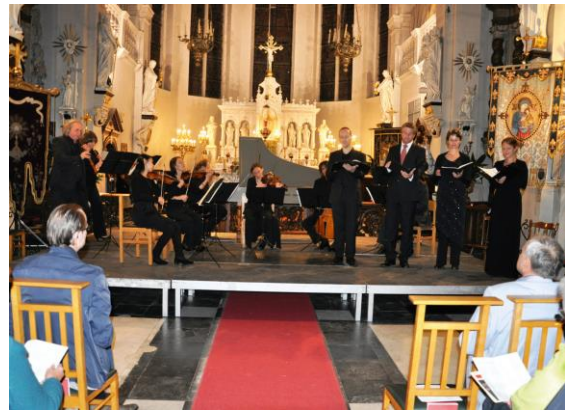
Ensemble Il Gardellino