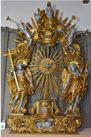
De expositietroon na de behandeling (zie verslag in Begijnhofkrant 38)