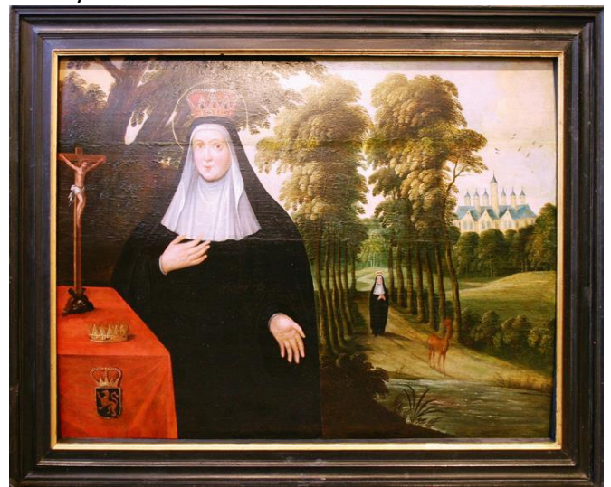
Nieuw kleedje voor schilderij waarop de legende van de H. Begga is afgebeeld.

afgebeeld, officieel over aan de Stad Turnhout (TRAM 41). Deze realisatie was mogelijk dankzij financiële steun van Rotary Turnhout.