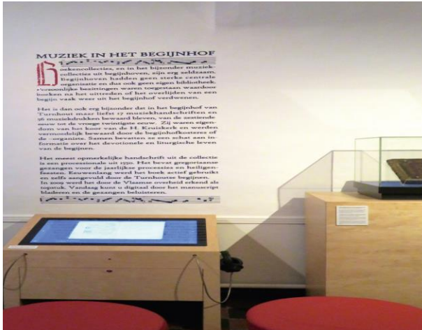
Een toprepresentatie van een topstuk in het Begijnhofmuseum