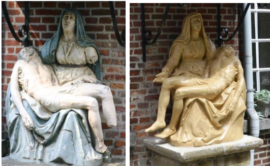
De sterk gehavende beeldengroep werd volledig in eer hersteld

Dit was een project van het OCMW en de Vrienden. Sinds eind juni 2014 is de piëta opnieuw te bewonderen in de binnentuin van de infirmerie. Dit project werd mogelijk gemaakt dankzij financiering van de Vlaamse Gemeenschap (80%) en De Vrienden (20%) (via de projectrekening bij KBS). Zie ook Begijnhofkrant 45 voor een uitvoerig verslag.