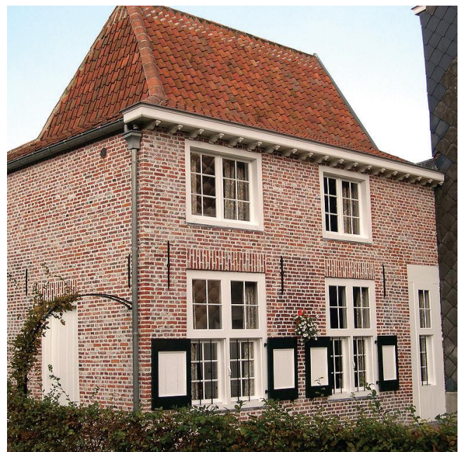
Het huis nr. 58, waar oorspronkelijk een vervallen huisje uit de 17de eeuw stond. Het werd in 2002 gereconstrueerd.