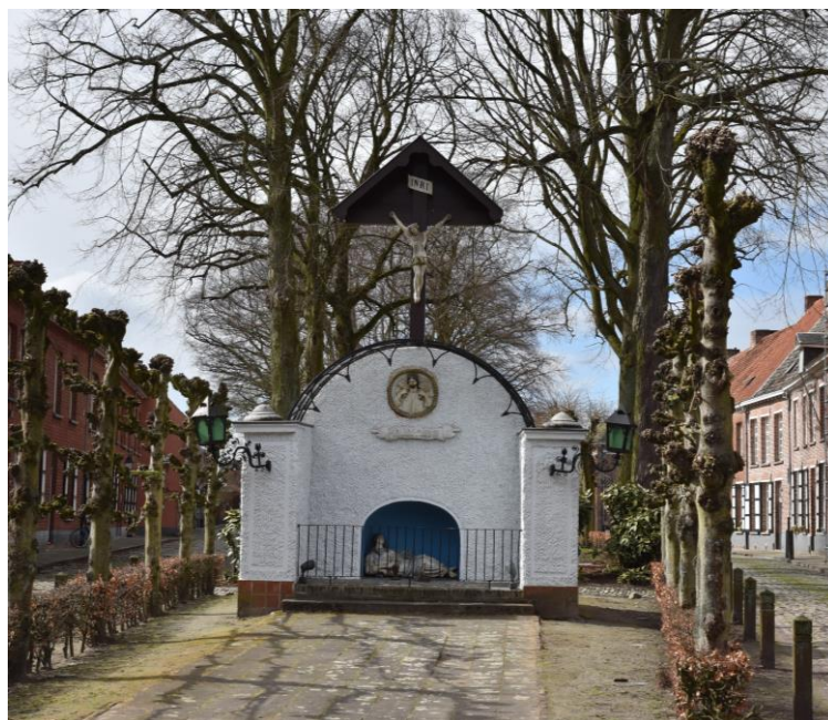
De eerste kerk op het begijnhof stond hier, vlak voorbij de hoofdingang. De inmiddels gerestaureerde Calvarieberg herinnert er nog aan.

De eerste kerk, die dicht bij de hoofdingang stond, werd verlaten. Wanneer de sloping precies gebeurde, is niet met zekerheid geweten. De nieuwe kerk werd tegen de kerkelijke traditie in met het koor naar de westzijde gebouwd en kreeg om praktische redenen haar voorgevel aan de oostzijde. Bij opgravingen in 1978 werden de fundamenten van de eerste kerk, meer bepaald de noordzijde, de westhoek en de oostabsis, blootgelegd 1 . De gereconstrueerde omtrek werd door middel van arduinen boordstenen aangegeven ter hoogte van de “Kruisberg” of Calvarieberg.