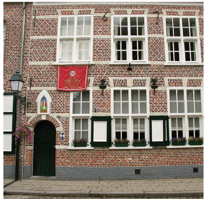
Het huis met nr. 53 en de H. Barbara boven de huisvest nu toegangsdeur dateert uit 1679, zoals blijkt uit de muurankers bovenaan.