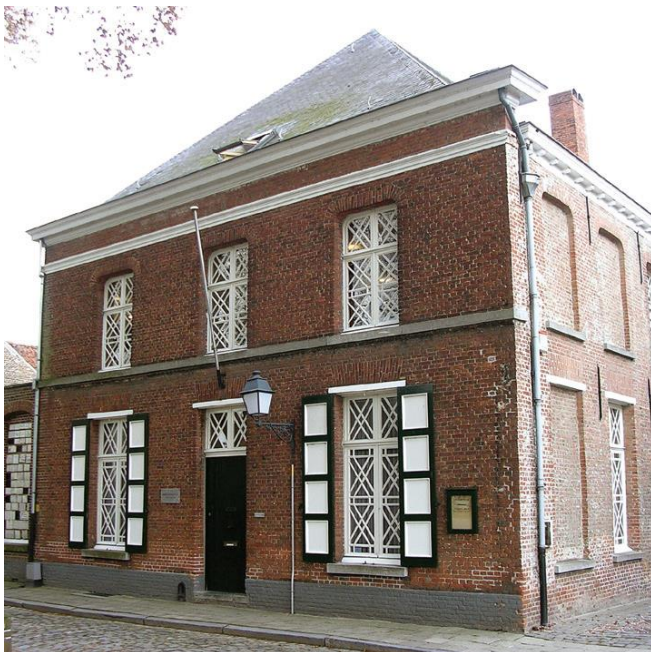
De voormalige Infirmerie (huisnummer 67) dateert uit 1614 en Brepols Publishers.