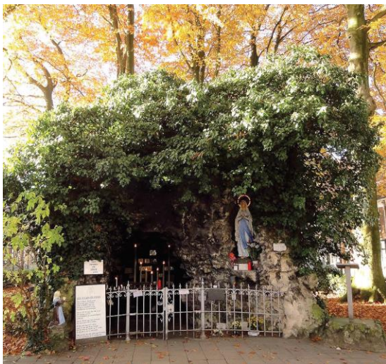
De Lourdesgrot uit 1876 is een kunstmatige rotsformatie naar een ontwerp van Frans Loyens, uitgevoerd door M. Blaton-Aubert uit Brussel, afgesloten met een verzinkt ijzeren hek.